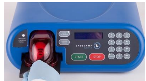
3-15 Kép: leszorító doboz behelyezése