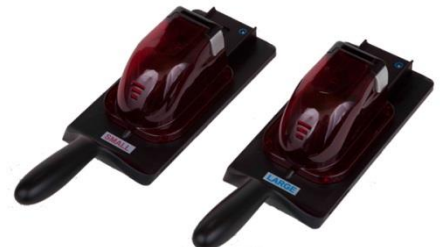
3-3 Kép Leszorító doboz

3.2.1 Előzetesen, annak függvényében, hogy fiatal vagy felnőtt állaton akar dolgozni, válassza ki a leszorító dobozt (kicsi vagy nagy méret). Lásd 3-3 kép, leszorító doboz