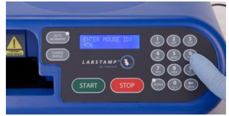
3-16 Kép: Azonosító megadása