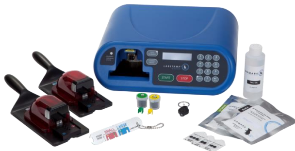
1-1 kép Labstamp System

A Labstamp System használatához az állatok elaltatása nem szükséges. Ettől függetlenül az állatok jólétével kapcsolatos aggályai esetén az Ön állatorvosi és/vagy állatgyógyászati Intézményes Állatgondozási és -felhasználási Bizottságának útmutatásait vegye figyelembe.