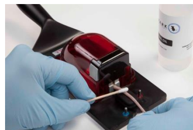
3-10 Kép Farok olaj felvitele