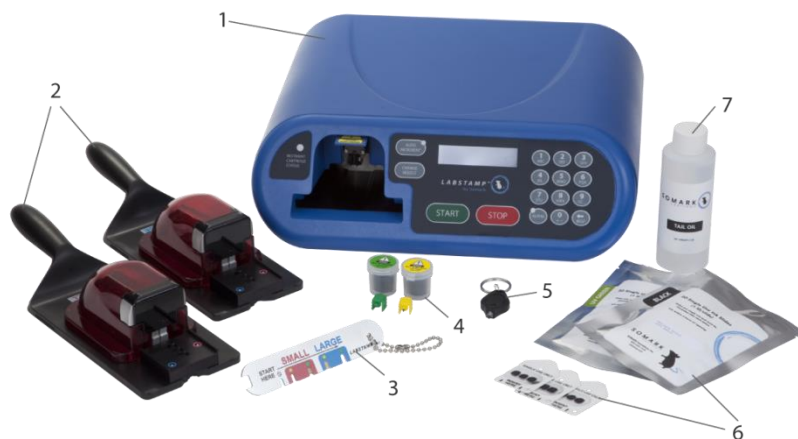
2-1 Kép Labstamp System