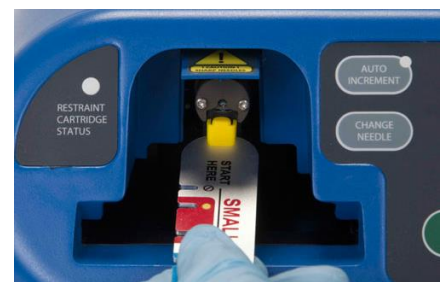
3-9 kép: farokmérő villas vége