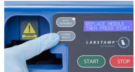
3-7 kép: tűcsere gomb

MEGJEGYZÉS: a berendezés első használatakor a tetoválópisztoly már a tűcsere pozícióban van, úgy hogy a tetoválópisztoly a berendezésből kiáll