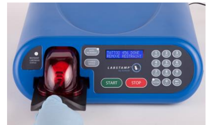
3-18 Kép: leszorító eltávolítása