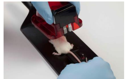
3-4 Kép Az egér rögzítése

3.2.5 A fark fogó gombokat még mindig benyomva tartva, finoman húzza hátra az egeret a fedél hátsó falához. Engedje el a fark fogó gombokat és rögzítse az egeret. Ezután elengedheti az egér farkát.