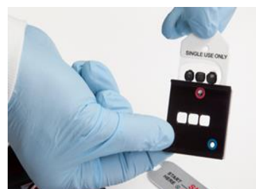
3-12 Kép: Tetoválófesték lemez behelyezése