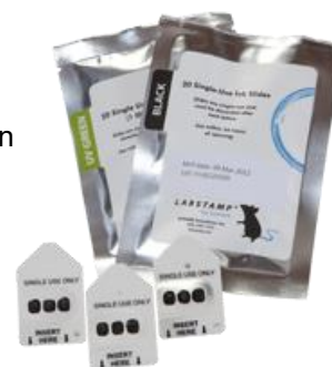
3-11 kép Tetováló lemez csomag