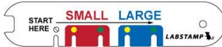
3-5 kép Fark mérő

FONTOS: A Labstamp fark mérő használatával meghatározható a megfelelő leszorító- és túdoboz kombináció. A mérőt minden egér esetében alkalmazni kell. Ezen eszköz megfelelő használatával biztosítható a legjobb minőségű és tartós tetoválás elkészítése. Csak az állat korára és súlyára vonatkozó adatokkal kiválasztott leszorító doboz vagy túdoboz használata nem garantálja a jó minőségű tetoválást.