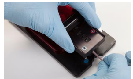
3-13 Kép: Farkok takaró

MEGJEGYZÉS: A faroktakarót mágnesekkel és vezető oszlopokkal szereltük fel, így biztosítva, hogy a faroktakaró a megfelelő helyre kerüljön.