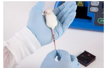
3-19 Kép: kész tetoválás

A tetoválás befejeztével szükség esetén tisztítsa meg a Labstamp alkatrészeit és folytassa a tetoválást egy következő egérrel. A rendszer tisztításával kapcsolatban kérjük olvassa el a Tisztítás és Karbantartás fejezetet.