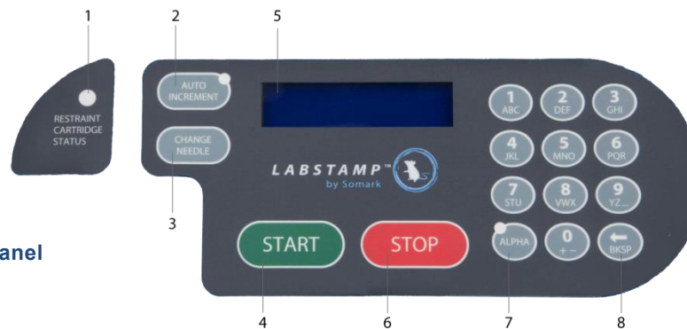
2-4 Kép Vezérlő panel