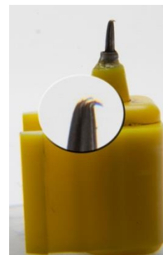
Figure 4-1 J-kampós tûfej

4.1.2.2 Vizsgálja meg a tûdobozt és ellenőrizze, hogy nincs-e sérült vagy J-kampós tûfej. Lásd 4-1 kép J-kampós tûfej.