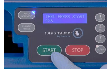
3-17 Kép Start gomb

MEGJEGYZÉS: A tetoválás megkezdésekor a leszorító doboz állapotát jelző fény piros villogásba kezd. Ne próbálja meg ebben az állapotban kivenni a leszorító dobozt a tetoválógépből.