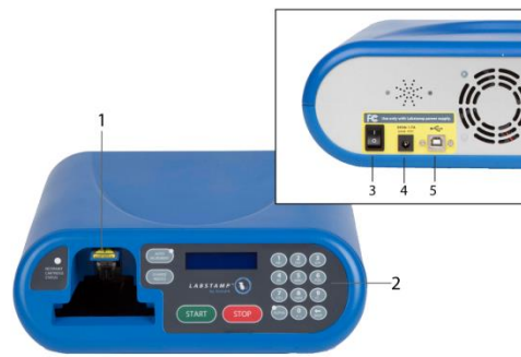
2-3 Kép Tetováló készülék