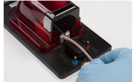
3-14 Kép: A farkok elhelyezése